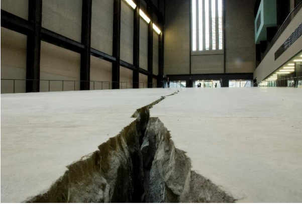
© Doris Salcedo, The Unilever Series: ris Salcedo, Shibboleth, October 2007–April 2008, Turbine Hall, Tate Modern, London 2017

maschinerie, die im Laufe der Menschheitsgeschichte auf immer barbarischere Weise perfektioniert wurde.